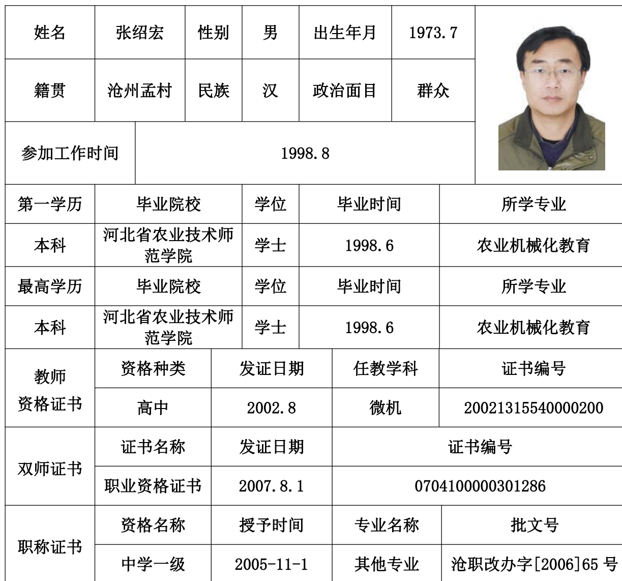
教师基本情况登记表