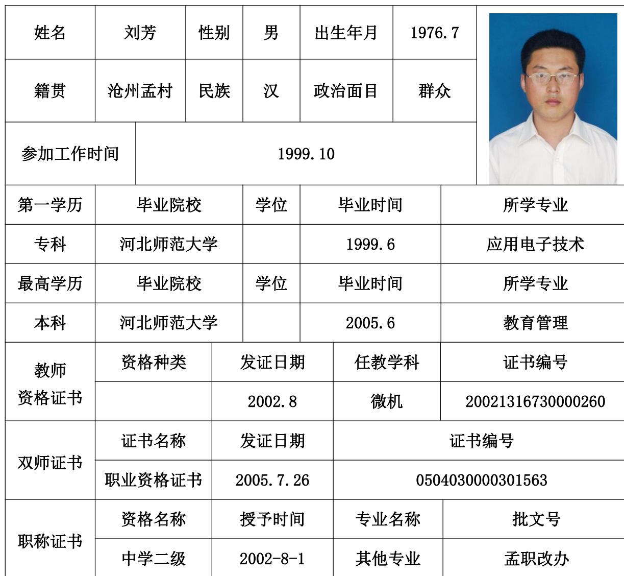
教师基本情况登记表